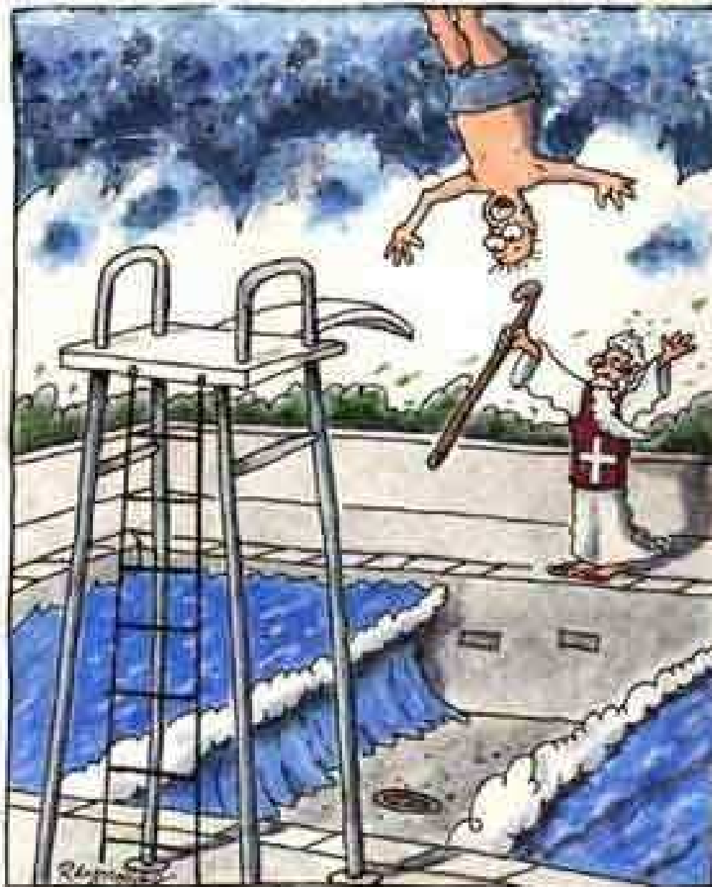
El primer y último día de Moisés como socorrista